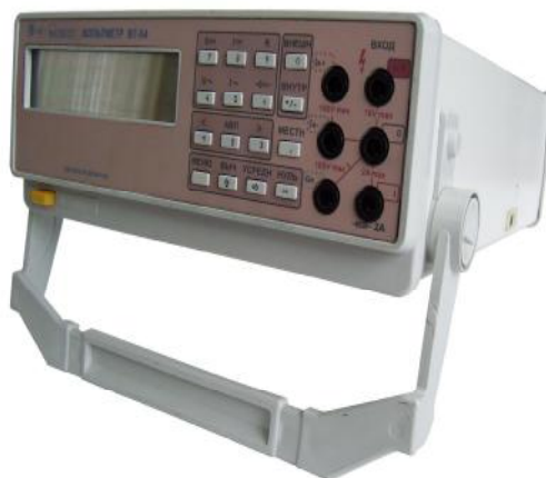
Рис.1 Общий вид вольтметров

Общий вид вольтметров приведен на рисунке 1.