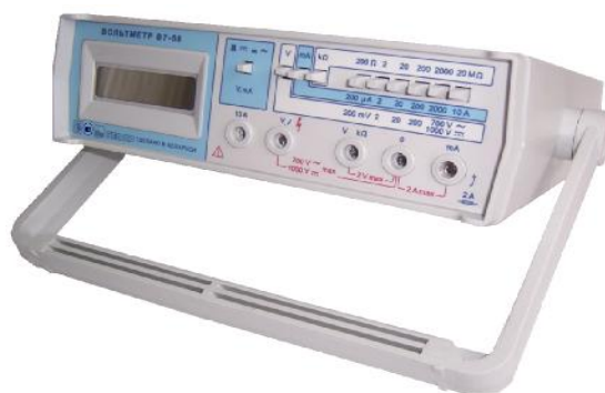
Рисунок 1 – Общий вид вольтметров

Общий вид вольтметров приведен на рисунке 1.